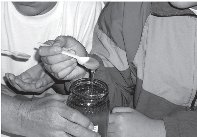
Los alumnos aprenden la importancia de la calidad de los productos.